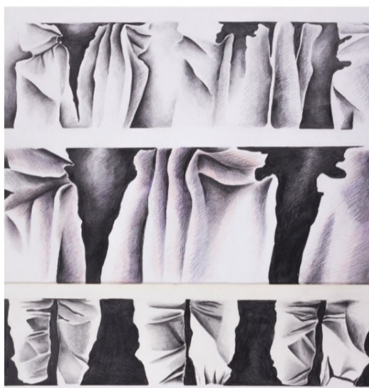
SUSANA RODRIGUEZ. Escritura sobre los pliegues , 1978. Grafito y lápiz color sobre papel. 100 x 66 cm